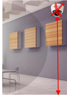
지면으로부터 5m이상 카메라 설치