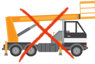
고소차(탑차, 스카이차) 이용공사