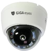
[실내형 돔 카메라]