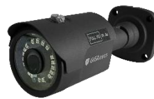
[실외형 블릿 카메라]